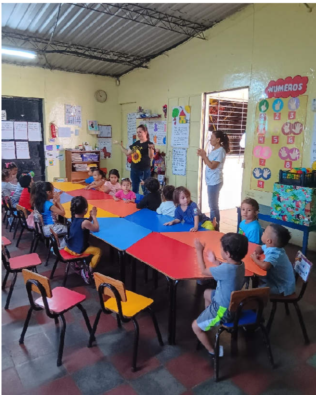
Kindertagesstätte vom 22. April