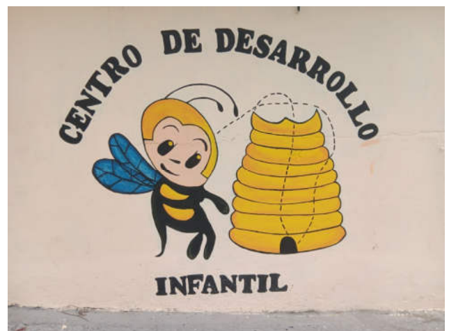
Bild auf der Außenwand der Kindertagesstätte vom 22. April (Zentrum kindlicher Entwicklung)