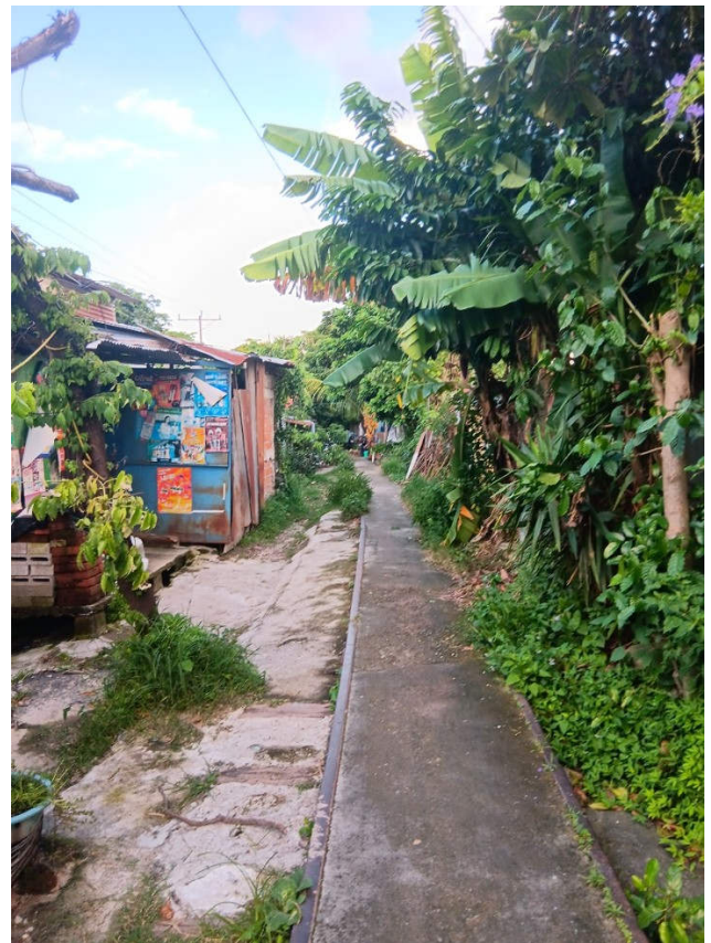
Ehemalige Bahnlinie in der Gemeinde vom 22. April

Über den Aufenthalt in Braunschweig hinaus wollen wir beiden aber auch die Gelegenheit geben, weitere Solidaritäts- und Unterstützerguppen in Deutschland, Österreich und Italien zu besuchen. Unsere Erfahrung mit regelmäßigen gegenseitigen Besuchen aus den letzten vierzig Jahren hat uns immer wieder gezeigt, wie wichtig, bereichernd und wertvoll diese