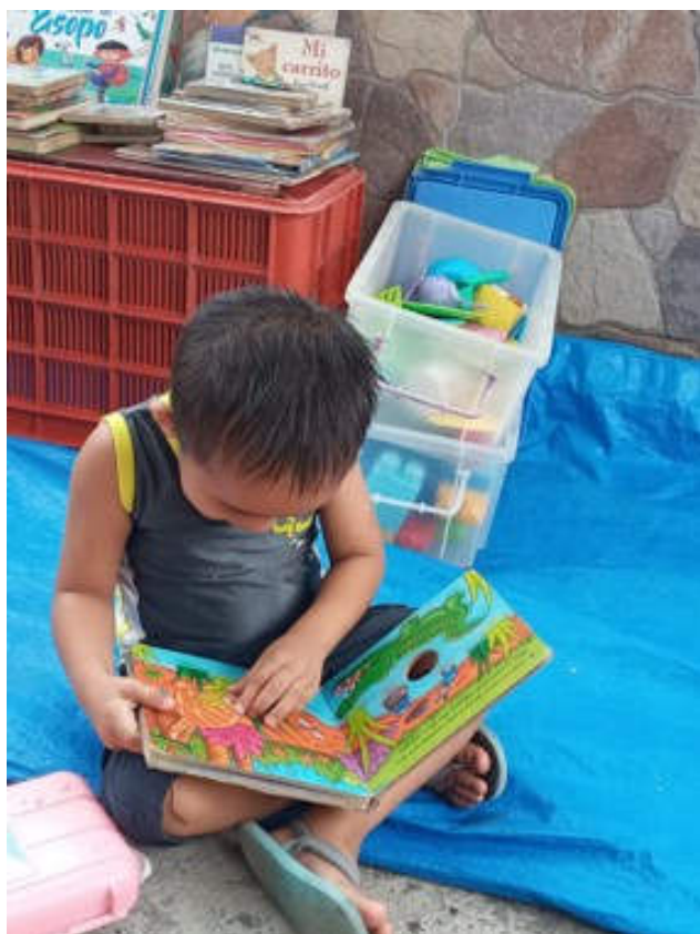
Schule unter freiem Himmel